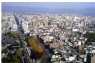
Fig. 4 La llanura de la ciudad de Kyoto con las montañas. A la izquierda el templo budista Higashi Honganji, templo Este y la avenida principal (Karasuma dori) con el Palacio Imperial en la parte Norte.