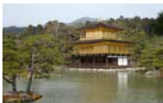
Fig. 6 La parte Norte de la ciudad de Kyoto desde el costado Oeste con el templo Kinkakuji (1955), Patrimonio de la UNESCO (foto del autor, 2013)