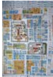
Fig. 3 Mapa del Palacio Imperial (1863)

Sin embargo solo después el traslado de la capital desde Nara en Kyoto empezó la construcción de los templos para proteger la ciudad en sus cuatro direcciones principales. Realmente la mayoría de los templos se construyeron a lo largo de las pendientes de las montañas orientales y occidentales y al interior de la ciudad a lo largo de la dirección Norte-Sur. El palacio imperial en Kyoto se colocó en el Norte al interior de un recinto muy grande, área amurallada, donde estaban también las residencias de los altos nobles (fig.3).