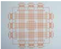
Fig. 1 El modelo Zhouli en una representación del año 1676 (Fuente, AA.VV. Atlas historique de Kyoto, 2008, p. 47)

Fue capital imperial en un país esencialmente rural y fue el centro de la cultura japonesa por miles de años, hasta 1868 cuando, en época Meiji (1868-1912), la capital fue trasladada en la actual Tokyo (literalmente “capital del Este”). Kyoto fue fundada en un contexto natural muy agradable, plano y con muchos ríos. La cuenca, en todo su perímetro, estaba protegida por las montañas y principalmente a lo largo del río Kamo comenzó el primer núcleo de la ciudad. Todas las ciudades nuevas, entre el siglo VII y el siglo VIII en Japón, fueron construidas sobre sitios no urbanizados y la regla principal, para la sociedad aristocrática del Japón entre el 593 y el 1185, fue el modelo de urbanización chino, denominado Zhouli (fig.1).