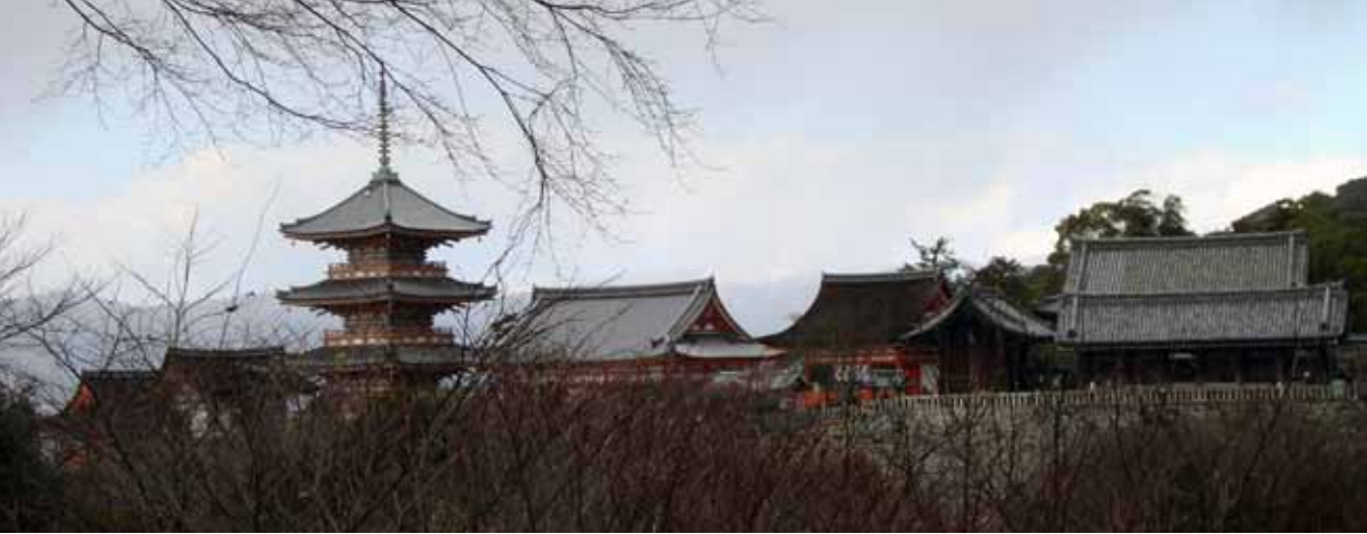
Kyoto, Kiyomizu Temple