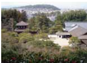
Fig. 5 La parte Norte de la ciudad de Kyoto desde el costado Este con el Templo Ginkakuji (1482), Patrimonio de la UNESCO