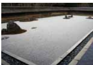
Fig. 7 Karesansui, jardín zen, del templo Ryoanji (siglo XVI)