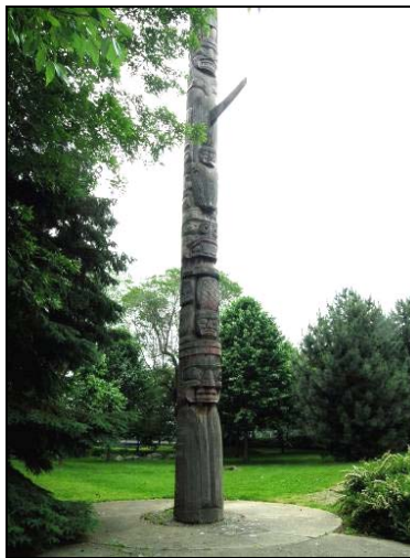
Figure 2. Le mât totémique de l'EXPO 67 avant les travaux de restauration.