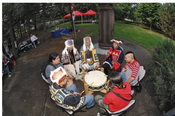
Figure 7. Accueil des artistes kwakiutls et des descendants de l'artiste Henry Hunt par une cérémonie du tabac et des chants interprétés par des Mohawks. (6 septembre 2007)