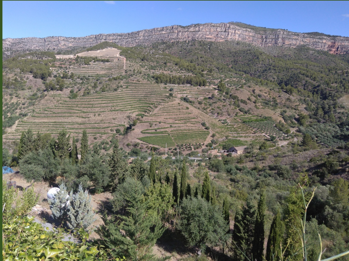
Priorat, Catalogne, Espagne

Maintaining the diversity of crops (vines, olive trees, almonds, livestock ...) and quality orientation without chemical inputs