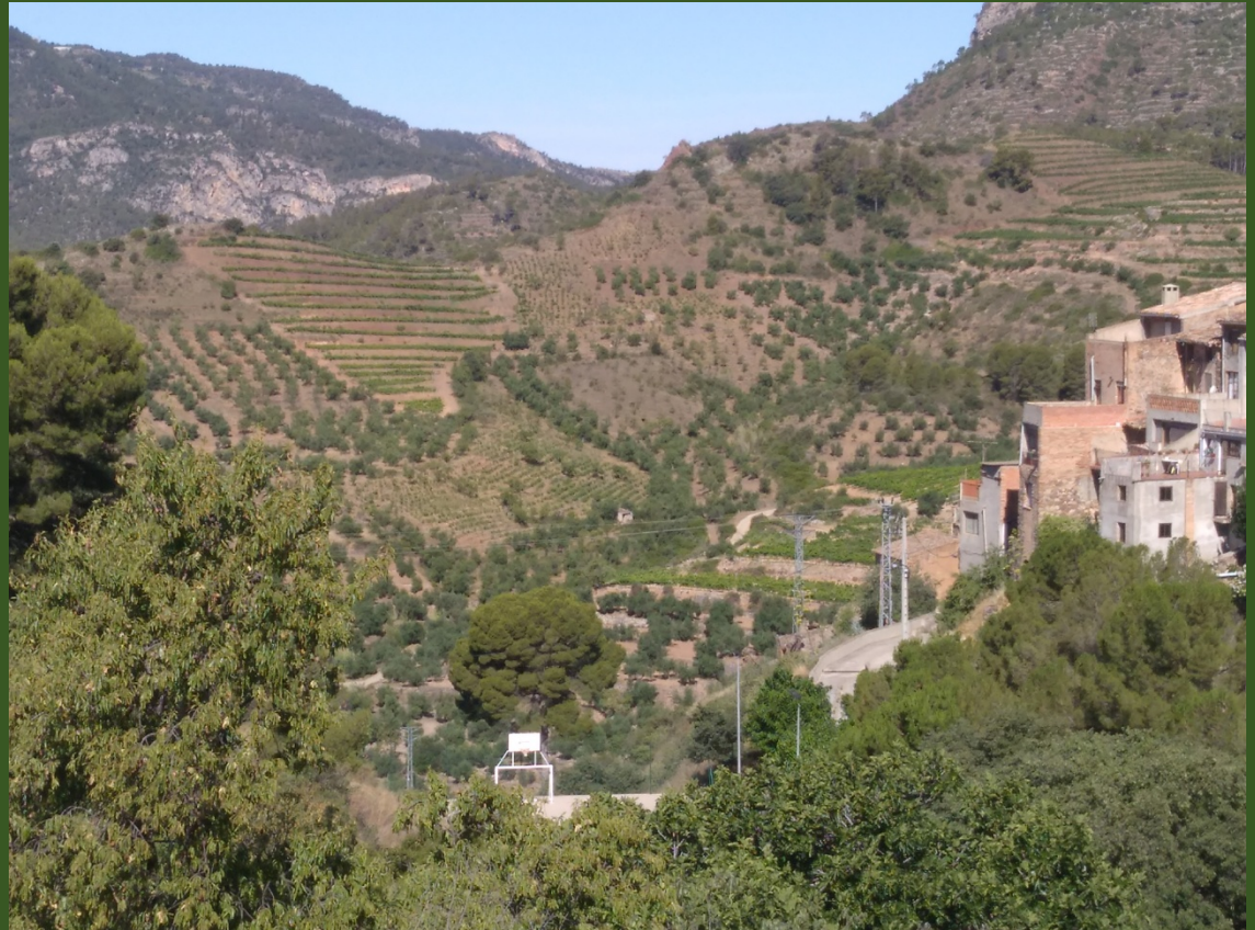
Priorat, Catalogne, Es pagne

Today, the Priorat postulates for the World Heritage List of Humanity