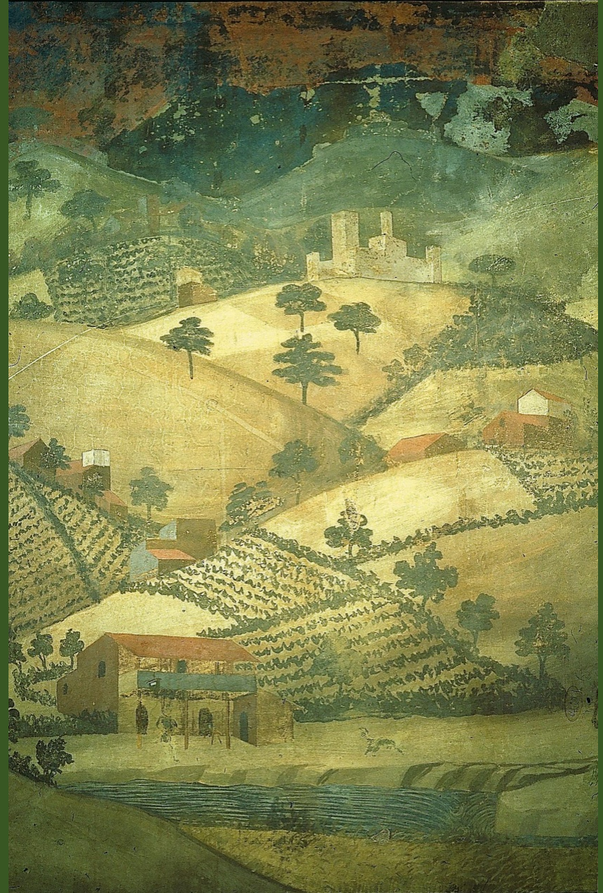
Détail de la fresque du Bon Gouvernement Detail of the fresco of the Good Government Ambrogio Lorenzetti