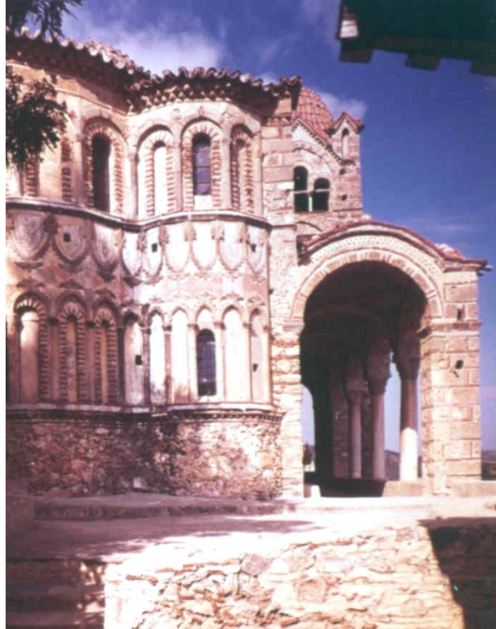
Mystras – Monastère de Pantanassa (Grèce)