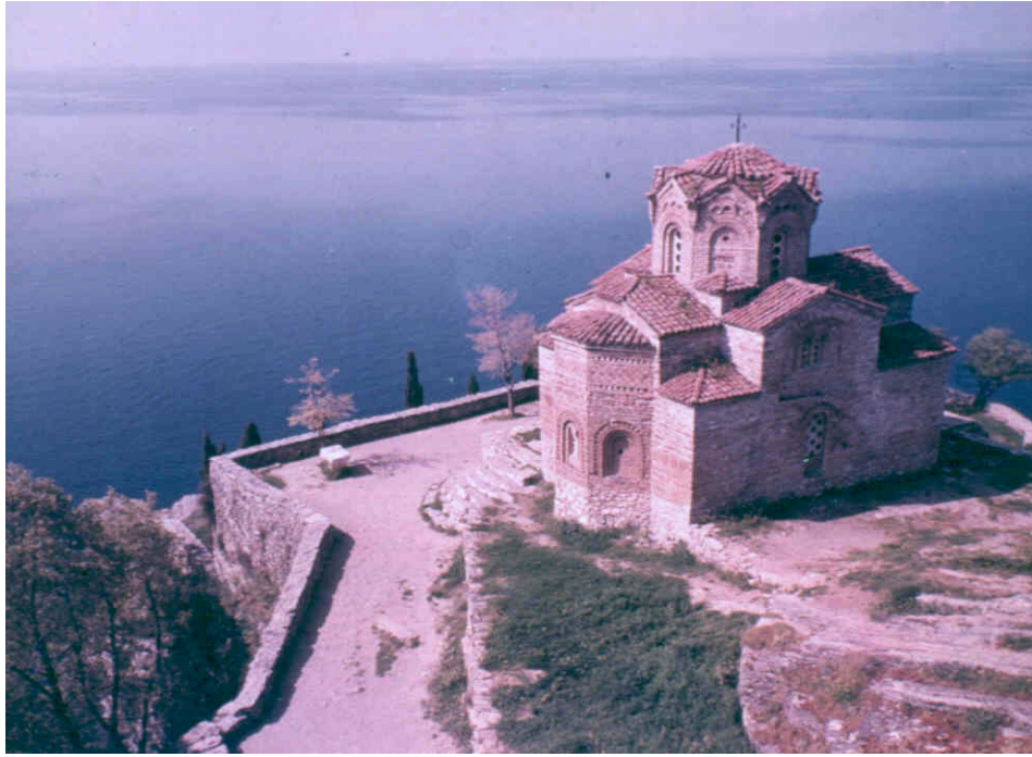
Monastère de la contrée naturelle et culturo-historique d'Ohrid (Ex-République Yougoslave de Macédoine)