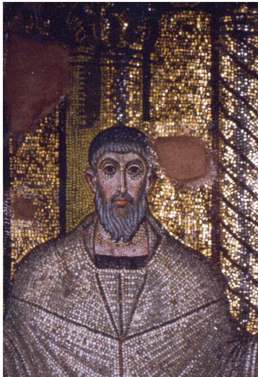
Monuments paléochrétiens et byzantins de Thessalonique Mosaique de la Rotonde (Grèce)