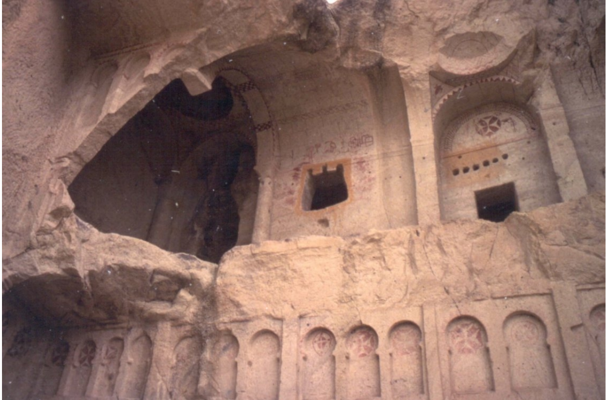
Parc National de Göreme et sites rupestres de Cappadoce Église Karanlık (Turquie)