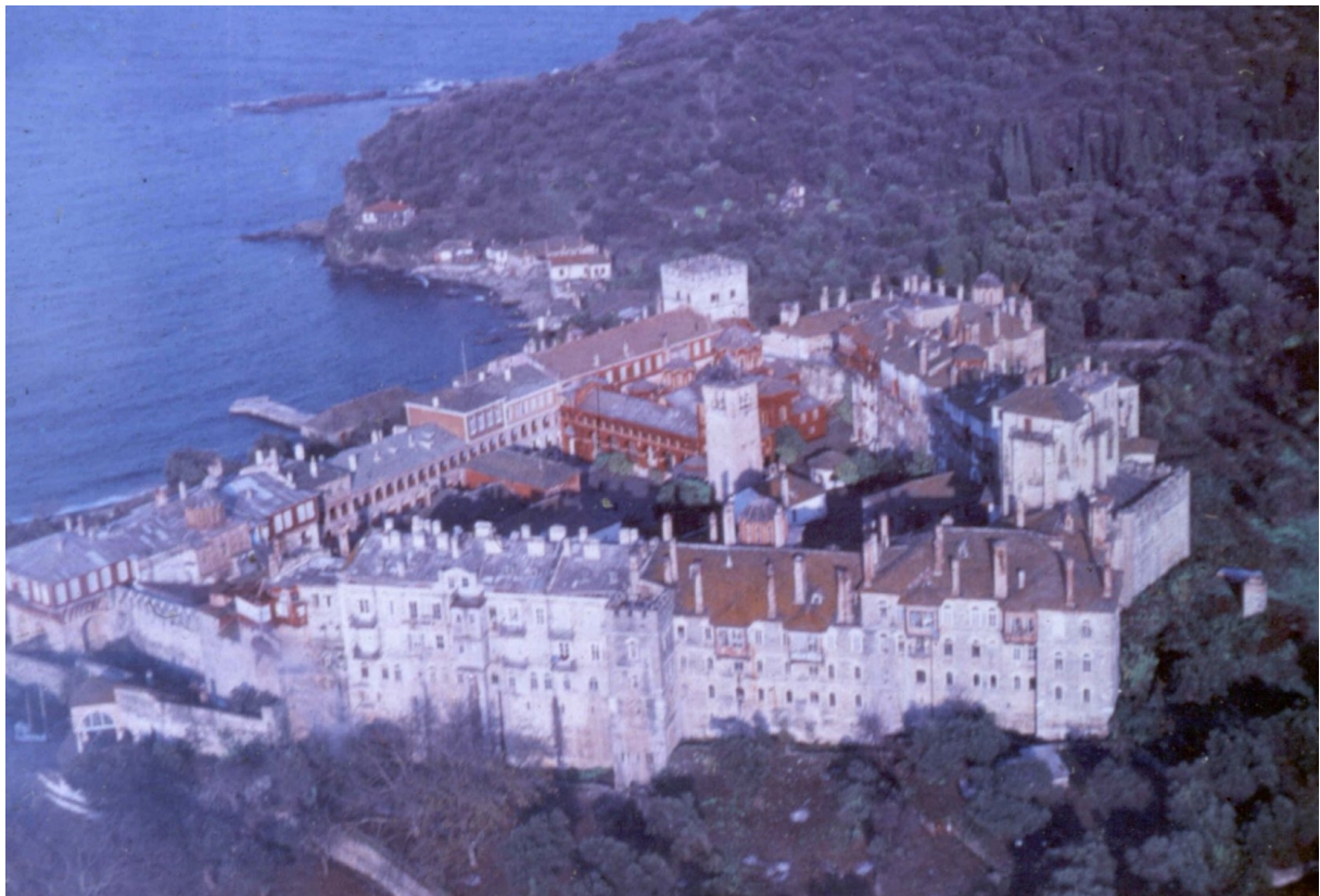
Mont Athos – Monastère de Vatopédi (Grèce)