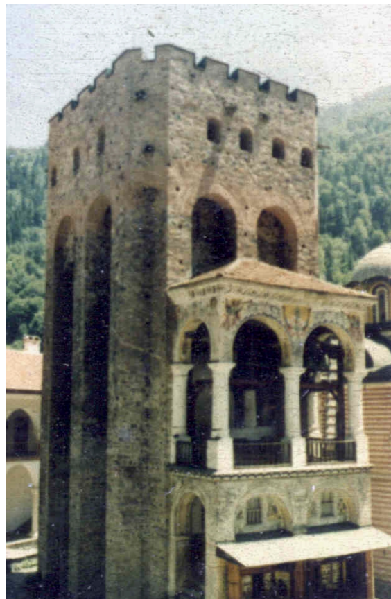
Monastère de Rila (Bulgarie)