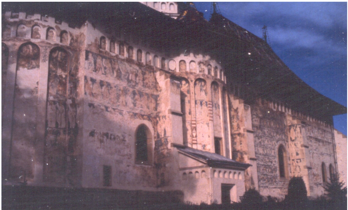
Églises de Moldavie – Église Saint-Georges de Suceava (Roumanie)