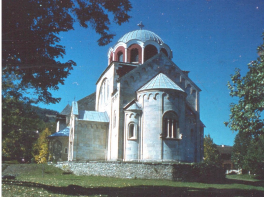
Monastère de Studenica – Église de la Vierge (Yougoslavie)