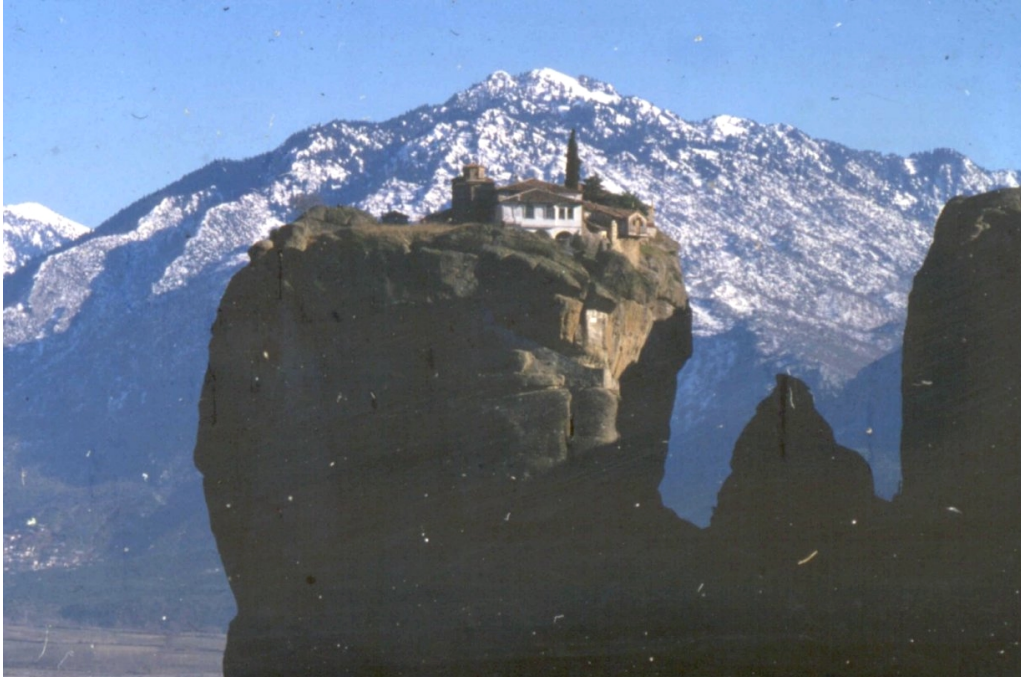
Monastère des Météores (Grèce)