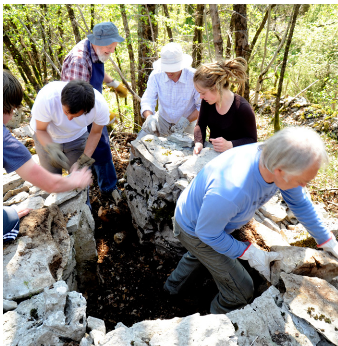
Slika 4: Delovni utrip, Lokev.