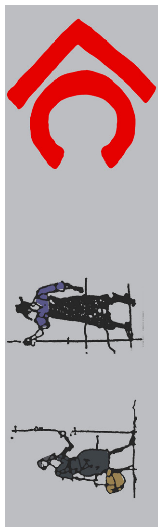
Slika 2: Utrinki z delavnice.