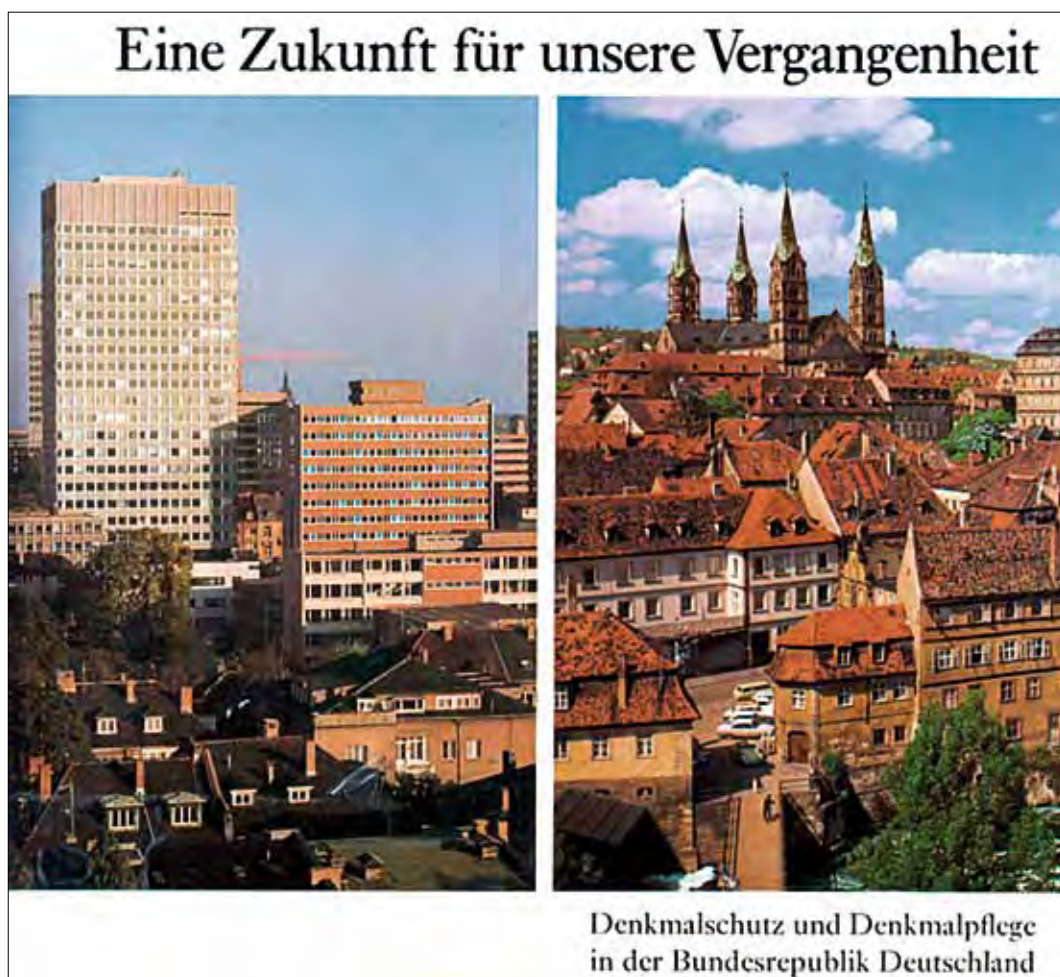
Abb. 2: Buch-Cover des Ausstellungskatalogs Eine Zukunft für unsere Vergangenheit als Teil des deutschen Beitrags zum Europäischen Denkmalschutzjahr 1975 (Petzet und Wolters 1975).