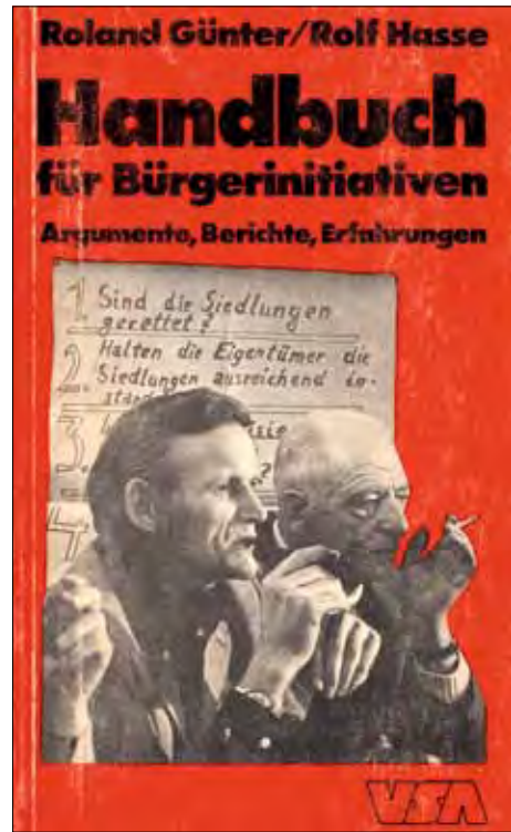
Partizipations-Schwelle: Zwischen Spekulation und Widerstand. Abb. 7a (links): Plakat aus Frankfurt Schöne Grüße aus dem Westend. Ihr Spekulant , um 1975; Abb. 7b (rechts): Buch-Cover zum Handbuch für Bürgerinitiativen. Argumente, Berichte, Erfahrungen von Roland Günter und Rolf Hasse, 1976 (Günter/Hasse 1976)

Participation Threshold: Between speculation and resistance. Fig. 7a (left): A poster from Frankfurt Best greetings from the Westend. Your Speculator (translation); Fig. 7b (right): Book cover of a Handbook for Citizens' Initiatives (translation) (Günter/Hasse 1976)