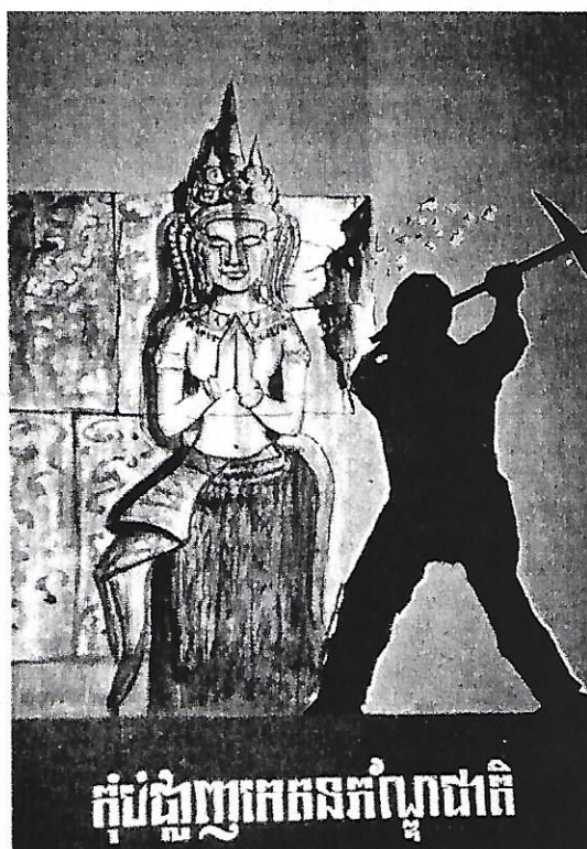
Affiche primée lors du concours de l'Université des beaux-arts de Phnom Penh et illustrant la lutte contre le trafic illicite! Winning poster of the competition at the University of Fine-Arts at Phnom Penh illustrating the fight against illicit traffic

There are risks of further thefts until all possible steps have been taken to combat this scourge effectively. The Cambodian authorities have received support from UNESCO to implement the most urgent measures and to launch an extensive awareness campaign throughout the country. Adopted in the course of a national workshop in July 1992, this plan involves informing the population, training conservators, the police and customs officers, enhancing security on monumental sites and in museums and reserves, the preparation of legislation and the registration of cultural property. Much still remains to be done, and it will be a long process. The problem is vast and there is no miracle solution. A whole panoply of measures need to be adjusted to the circumstances and implemented, through patient efforts to persuade and educate. Other countries have managed to stem the traffic, and the foundations have now been laid in Cambodia to tackle this important task of preserving the country's rich cultural heritage.