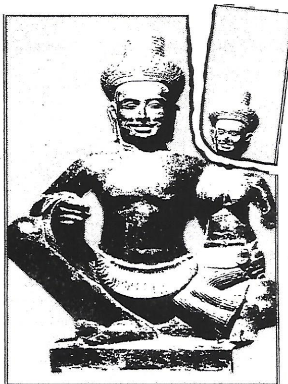
Shiva and Uma from Banteay Srei, Angkor. Uma's head was stolen from the statue in the National Museum during the 1970s.