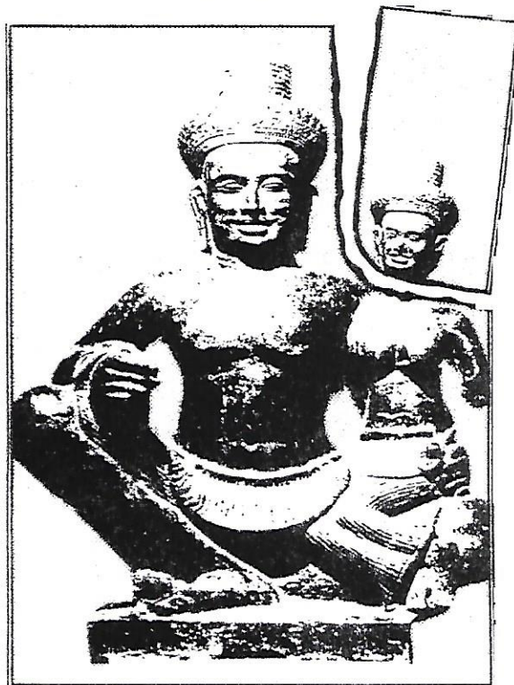
Statues d'Uma et de Shiva (temple de Banteay Srei, Angkor). La tête de la statue d'Uma fut volée au Musée national pendant les années 70.