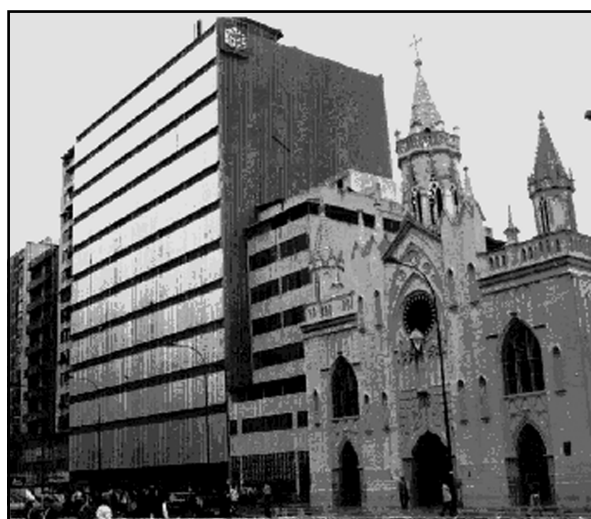
Aspecto actual de la iglesia del Sagrado Corazón de Jesús en su transformado contexto urbano