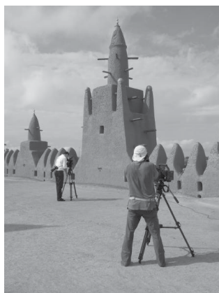
Figure 3. Mopti, Mosquée : La reconnaissance du patrimoine malien en fait un sujet régulier de documentaires télévisés.

Dans l'habitat, les équipements et les infrastructures, l'introduction du ciment et de l'acier répond à deux problématiques récurrentes que sont l'augmentation des portées et la suppression de la corvée annuelle du crépissage d'argile. Dans l'habitat, la modernisation