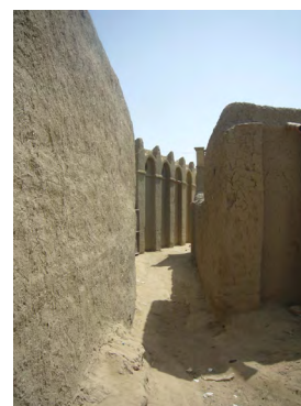
Figure 10. Saraféré