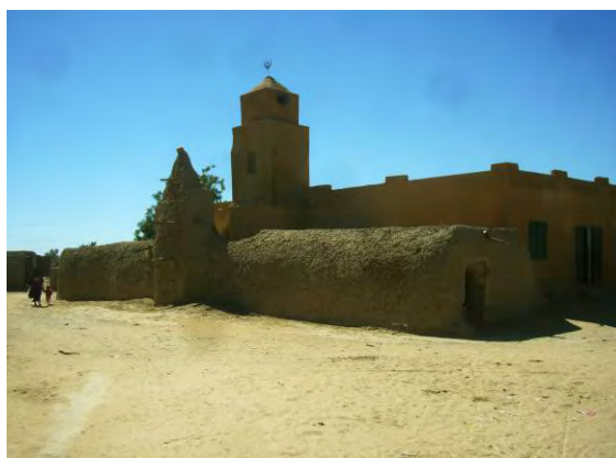
Figure 5. Mosquée traditionnelle et extension moderne, cercle de Niafouké.

Des alternatives sont identifiées, la voûte nubienne (lavoutenubienne.org, 2011) et la Briques de Terre Comprimées (BTC, dosées de 6 %12% de ciment) sont soutenables mais restent sous exploitées.