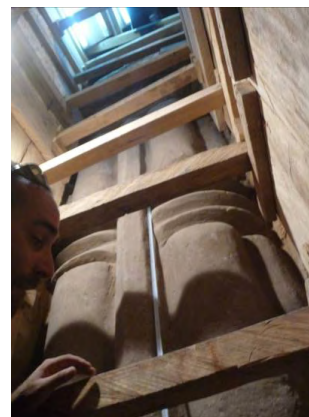
Figure 8. Tombouctou. Vue d'un pilier décoré de l'ancienne mosquée, 4m sous le niveau de l'actuelle mosquée.