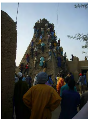
Figure 2. Tombouctou. Vue d'oiseau sur la vieille ville