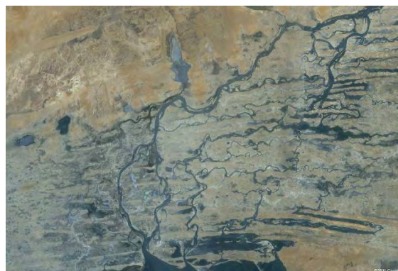
Figure 9. Vue aérienne du Delta intérieur du Niger.

Les deux projets furent l'occasion d'établir des actions sociales pour les salariés réguliers dont : le suivi médical, l'alphabétisation, le micro-crédit ponctuel. Ces actions impliquent profondément le projet dans la vie sociale et doivent être finement estimées puis évaluées, afin de ne pas troubler les équilibres locaux.