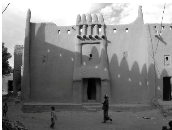
Figure 4. Djenné. La maison du chef de Village illustre de nombreux articles. A l'instar de la ville, le bon état de la façade contraste avec un bâtiment en mauvais état sanitaire.