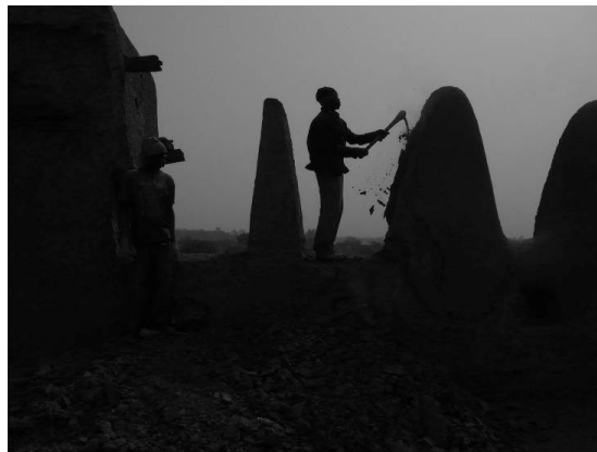
Figure 7. Djenné. Mis au jour des profils originaux de Salafels couronnant la mosquée.

L'histoire de la mosquée de Djenné est mieux connue