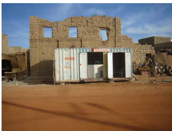
Figure 6. Tombouctou. Abandon d'une maison en terre et installation d'un container

Les architectures des Mosquées de Tombouctou et Djenné se distinguent l'une de l'autre par leurs volumes, leurs histoires, leurs techniques. Chacune incarne une typologie déclinée tout le long du delta intérieur du Niger et dans la