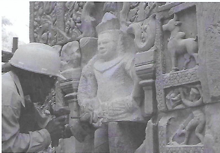
Pillage – temple de Preah Khan