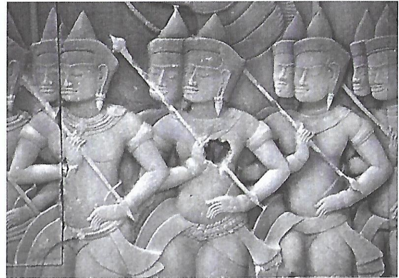
Impact d'une balle

Cambodia's unequalled cultural heritage – and in particular Angkor – was not spared the sufferings that country endured from 1970 onwards. Cambodia went through 30 years of conflict, with the Khmer Rouge régime (1975-1979) marking the peak of cruelty and ideological barbarity. These years have left a permanent scar on the country and its memory. Monuments and archaeological sites in particular suffered the consequences of abandonment, vandalism, looting and lack of maintenance, together with the effects of military use. However, despite the traces of vandalism that bear witness to the sites' having been subjected to military occupation, the temples suffered less during the fighting than had been feared. The application of certain of the provisions contained in the Hague Convention for the protection of cultural property in the event of armed conflict of 14 May 1954 played a crucial role in protecting Cambodian heritage. The Convention constitutes one of the most important tools for the protection of cultural property under international humanitarian law. It clearly helped to protect cultural property by providing the Cambodian authorities with a legal basis and, above all, by legitimizing the action they undertook in this area.