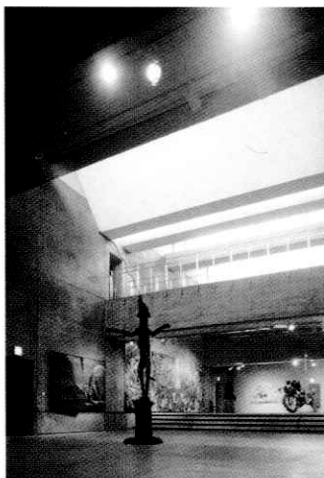
PAG. 16 Galleria d'Arte di Oita (Giappone), hall d'ingresso.