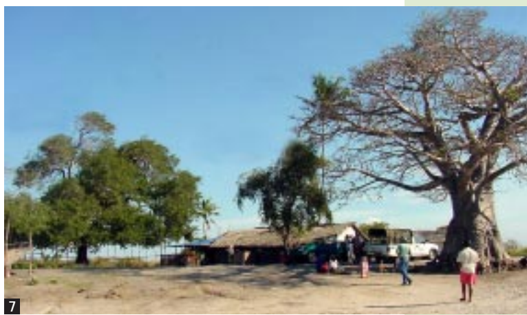
Figura 7 Alcune specie botaniche presenti a Tandanhangue, punto d'imbarco per l'isola di Ibo.

la spedizione del navigatore portoghese Vasco de Gama nel 1498.