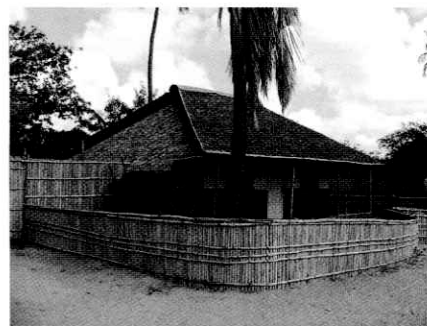
PAG. 68 Mozambico, tipologia edilizia locale.