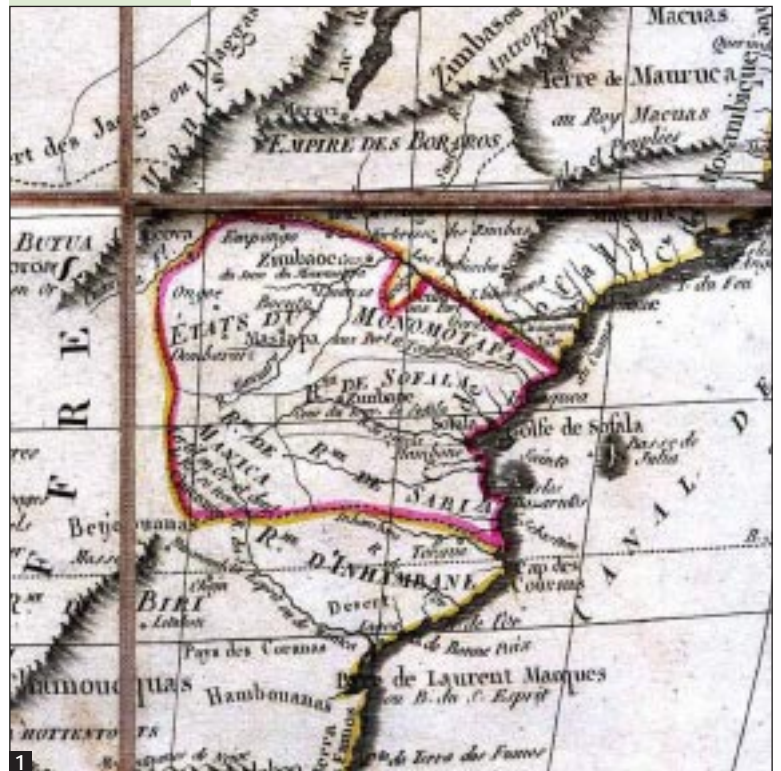
Figura 1 Una carta geografica del Mozambico del 1829.

Le città del Mozambico rispondono tutte a modelli coloniali e, con poche eccezioni, sono di impianto relativamente recente, anche se l'origine può essere più antica. La maggior parte, anche se portano oggi nomi antichi di luoghi ricchi di storia, risalgono agli ultimissimi anni del XIX secolo, quando iniziò l'occupazione militare dell'interno, o sono di poco posteriori, fino agli anni 40-50 del XX