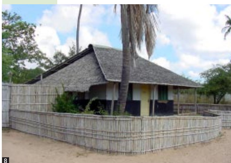
Figura 8 La tipologia edilizia locale, che mescola elementi swahili e portoghesi si presta in maniera particolare alla riconversione turistica.

Le azioni di recupero o restauro intraprese da parte dei residenti o dell'Autorità pubblica sono praticamente irrilevanti, cosicché la città versa, oggi, in un grave stato di degrado e, in molti casi, di rovina. L'ultimo restauro di un certo rilievo, eseguito con la dovuta maestria tecnica, fu quello realizzato a cura dell'architetto João Quirino da Fonseca, su incarico dell'Amministrazione coloniale, nei primi anni 70, alla vigilia dell'indipendenza del Paese. Si assistette allora al restauro di tre edifici: uno destinato a museo (il cui restauro fu terminato nel 1974), un altro in cui oggi ha sede la scuola E.P.II, e quello denominato Pensão Paraíso. Questa situazione non riflette, tuttavia, l'interesse che recentemente è stato chiaramente dimostrato sia dai Ministeri della cultura e dell'ambiente del Mozambico, sia da diverse realtà private. Si tratta di un interesse motivato da una presa di coscienza del valore del patrimonio storico ed ecologico. Recentemente è stato creato il Parque Natural das Quirimbas, che comprende tutte le isole e l'a-