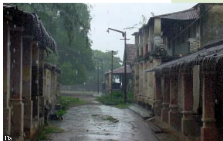
Figura 11 b Rua Maria Pia, con edifici ispirati ai modelli sud portoghesi.