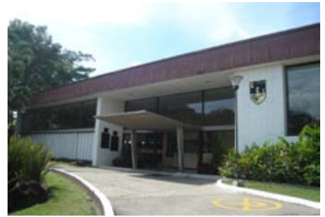
Fachada principal del Club Campestre de Ibagué, agosto 2011.

En estos mismos años se impuso el desarrollo de la arquitectura moderna, aunque muchos investigadores no la reconocen como una tendencia, la que