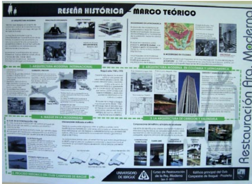
Figura 8. Reseña histórica, realizada por uno de los colectivos de estudiantes, Ibagué, agosto 2011

informaciones fueron socializadas en el seminario realizado y posteriormente fueron presentadas por cada uno de los equipos (4) las propuestas o ideas conceptuales, que se plantearon para la recuperación del inmueble objeto de estudio. (Figuras 8-13).