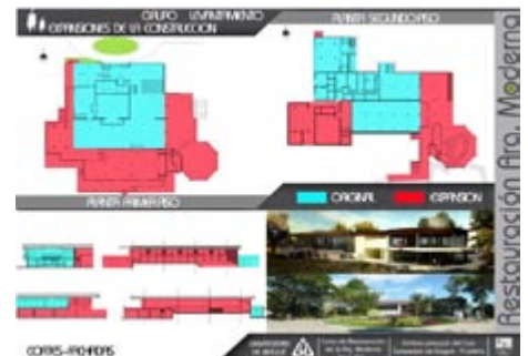
Figura 11. Propuesta de intervención. Colectivo de estudiantes, Ibagué, agosto 2011.