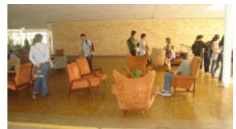
Figura 12. Los estudiantes en una visita al Club Campestre de Ibagué. Foto: Flora Morcate, agosto 2011.