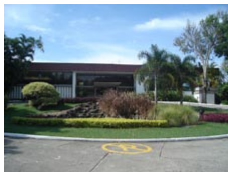
Figura 6. Vista exterior del Club Campestre de Ibagué. Foto Flora Morcate, 2011.

Para estos análisis se realizaron visitas al Club Campestre de Ibagué, de los profesores con los estudiantes, así como la búsqueda de información, en los propios archivos del edificio objeto de estudio, en las bibliotecas de la ciudad, en la Academia de Historia de Ibagué y fueron concertadas y realizadas entrevistas a directivos, trabajadores y socios de dicho club, estas