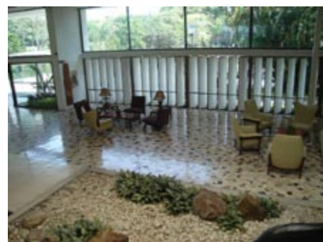
Figura 7. Vista interior del Club Campestre de Ibagué. 2011.