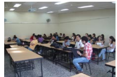
Figura 13. Grupo de estudiantes en una de las clases del curso de verano en la Universidad de Ibagué, agosto 2011.