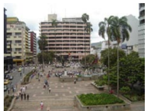
Figura 4. Ibagué. La Gobernación de Tolima, nuevo proyecto de los años 60 del siglo XX, obra de Pizano-Pradilla- Caro 1955-60, fuente: Archivo Banco de la República, sucursal de Ibagué.