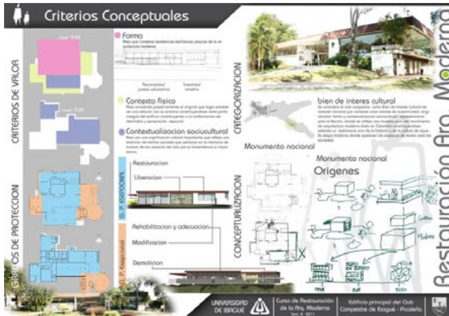
Figura 9. Propuesta conceptual de un colectivo de estudiantes, Ibagué, agosto 2011.