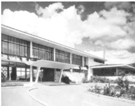
Figura 2. Country Club de Bogotá obra de dos firmas: Obregón & Valenzuela y Jorge Arango.

Sin embargo, las intervenciones en las ciudades, en estos años fueron muy puntuales y se basaron principalmente en los principios del documento CIAM 1932. El desarrollo de la arquitectura moderna determinó claramente un fuerte crecimiento de las principales ciudades colombianas y entre estas, además de Bogotá, Medellín, Bucaramanga y Pereira, se encuentra la ciudad de Ibagué, capital del Departamento del Tolima. El “movimiento modernizador” llegó a Ibagué como un huracán, barriendo para siempre obras de arquitectura colonial y republicana de interés histórico y artístico. No existió ninguna planificación y todo fue realizado en nombre de la “modernidad”. [7] Un ejemplo es la antigua Gobernación republicana destruida para construir el nuevo edificio de la Gobernación del Tolima con un proyecto del grupo Pizano-Pradilla-Caro. (Figura. 3 y 4)