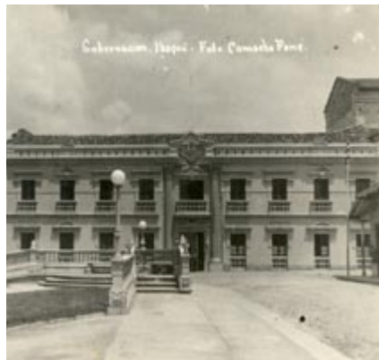
Figura 3. Ibagué. La Gobernación de Tolima (1920).