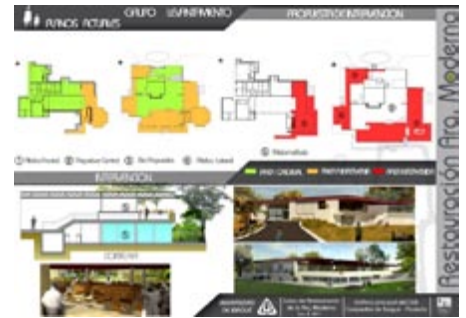
Figura 10. Análisis de las expansiones de la edificación, colectivo de estudiantes, Ibagué, agosto 2011.