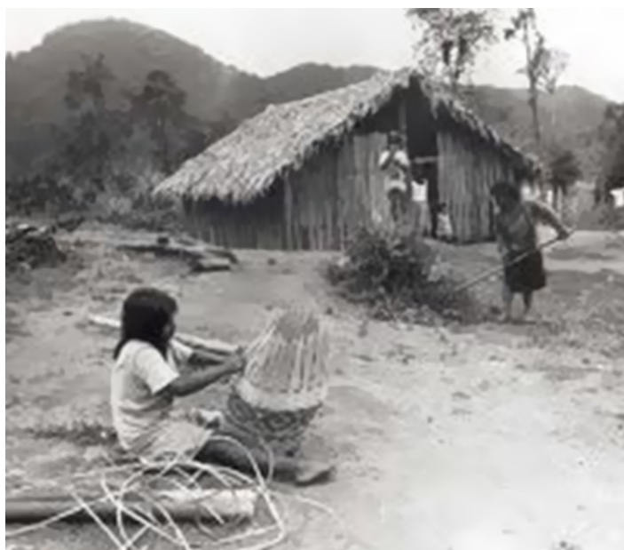
Figura 2. Mujer guaraní haciendo cestería.

La simbiosis hispano - guaraní tiene una historia propia. Una historia rica en cultura propia enraizada