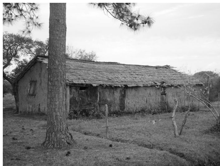
Figura 1. Casa de adobe en Cnia. Carlos Pellegrini.

muchas de adobe (Fig.1 En Cnia Carlos Pellegrini.), muy lejos de la modernidad, la vida pueblerina que se respira desde que se pisa estos pueblos, es diferente. El cartel de bienvenida 35 en algunas de estas casas, que reemplazaría a las palabras que parecen querer expresar sus habitantes pero que no se animan a decirlo, anticipa una forma de ser: gente amable, confiable, afectuosa. Se acentúa en sus comidas típicas, que ofrecen con orgullo, en su gusto por su música y el baile, el chamamé, el mate, la caña con ruda, que se bebe todos los 1° de agosto, la sonrisa tímida de la gente que denota gran devoción por la fé que profesan a sus santos, son solo algunas características que ayudan a definir esta “sociedad correntina”.