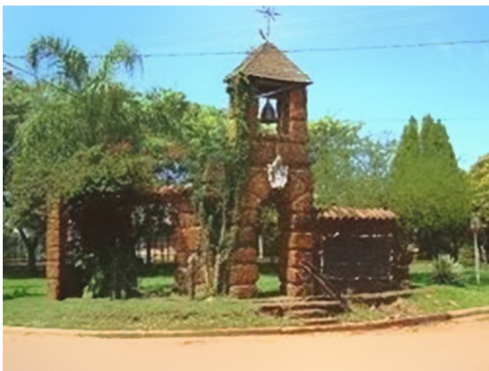
Figura.3. Vestigios de las reducciones. Santo Tomé

Entre 1609 y 1818, en el corazón de la Cuenca del Plata, en territorios de Argentina, Brasil, Paraguay y Uruguay, se desarrollaron las Misiones Jesuítico Guaraníes (Fig. 3).