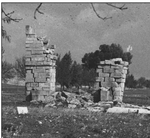
Figure 01 : AVANT

L'avant dernière assise du monument (ou la première de l'attique) est constituée de boutisses.