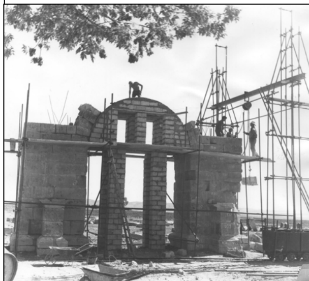
Figure 04 : Gunther règle la chape du coffrage.

Quatre d'entre-elles, que j'ai fait regrouper de part et d'autre de l'axe du monument présentent des traces d'outils attestant qu'elles ont été préparées pour constituer un lit d'attente partiel (voir les parties hachurées sur la figure 05).