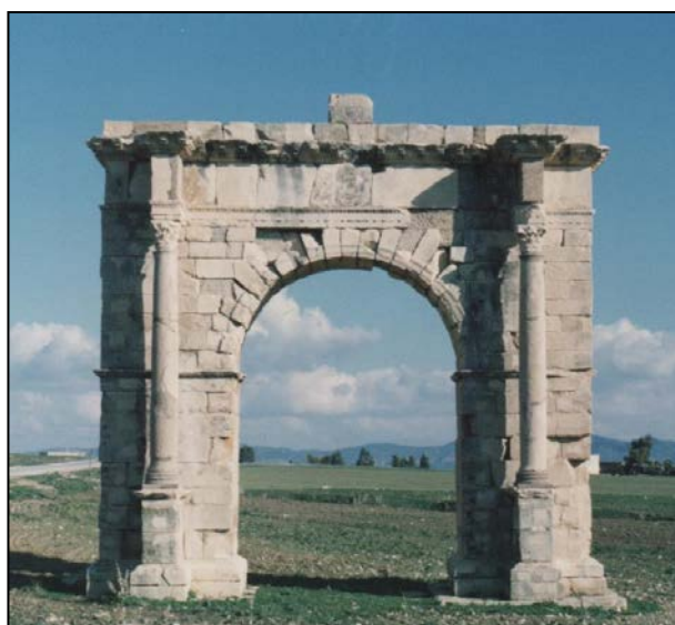
Figure 02 : APRES