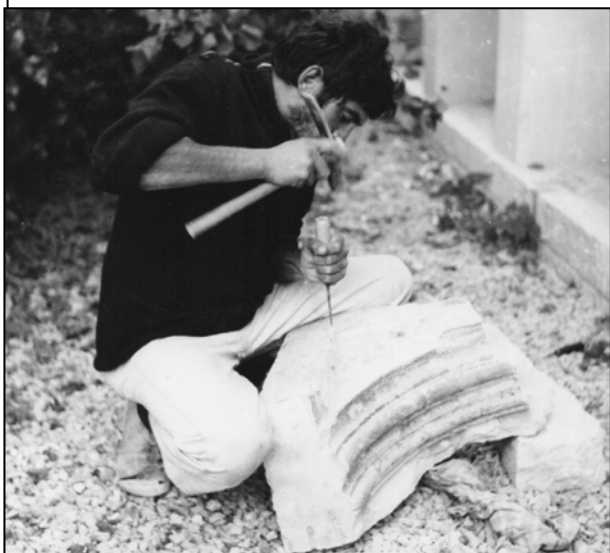
Figure 03 : J'étais l'ouvrier spécialisé du chantier.