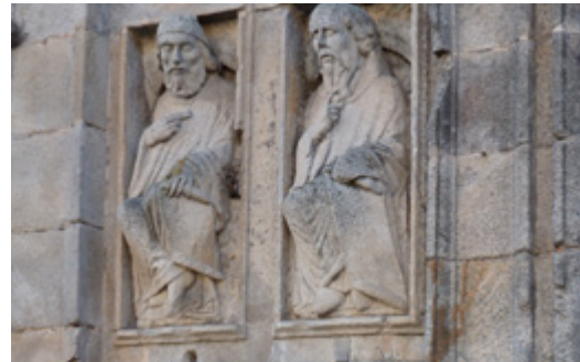
Détail du portail roman.