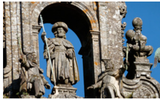
Cathédrale Saint-Jacques de Compostelle : détail de la façade ouest.

Ces trois lieux ont été les trois pèlerinages majeurs de la chrétienté, et la figure du