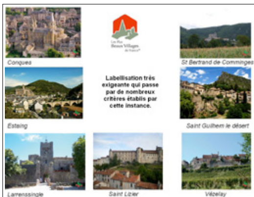
Les plus beaux villages de France.

Les structures précitées pourraient-elles servir d'exemple et devenir des structures miroirs pour l'itinéraire culturel des chemins de Saint-Jacques en France ?