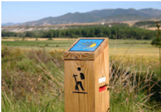
Balisage du chemin de Saint-Jacques.