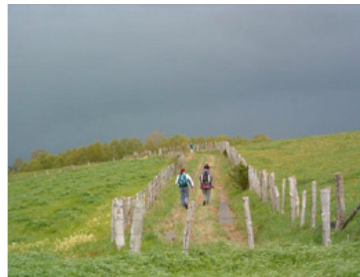
Pèlerins sur les chemins.