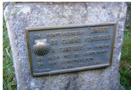
Plaque du chemin portugais, Pontevedra.

Ces travaux pourraient permettre, à moyen terme, de revisiter la logique de protection et mise en valeur d'un réseau plus dense et plus continu des chemins de Saint Jacques au sein de notre système de protection français. En suivant, cela permettrait à l'Etat français, dans une position de dialogue avec l'UNESCO, de refonder les critères de valeur universelle exceptionnelle pour la série, dans une logique d'accroissement de la densité des sites et portions de sentiers protégés, et d'établir un véritable plan de gestion pour cet itinéraire culturel. Une coopération culturelle avec l'Espagne permettrait une fertilisation croisée de ces itinéraires à vocation transfrontalière.