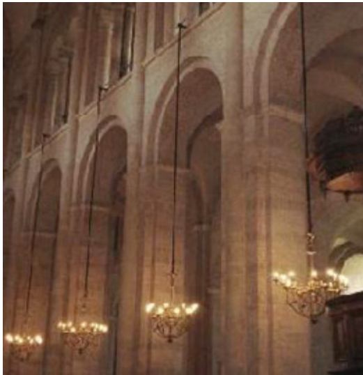
Eglise Saint-Sernin, Toulouse.