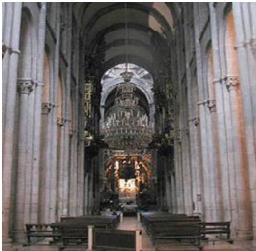
Cathédrale Saint-Jacques à Compostelle.