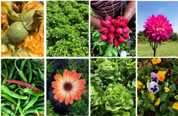
Imagen 11. Los cultivos que se producen en las chinampas y terrazas agrícolas, San Gregorio Atlapulco

Como segunda estrategia se propone la restauración de la red de canales a partir de la limpieza de cauces obstruidos, la rehidratación de secos y el mantenimiento de los navegables, además de la rehabilitación de los embarcaderos de carácter local.