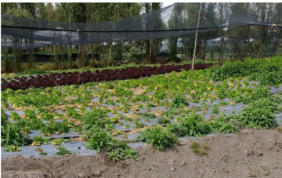
Imagen 7. Efectos de un periodo de sequía en los cultivos de hortalizas, San Gregorio Atlapulco

Con respecto a los períodos de sequía, son las zonas más altas las que padecen los efectos de mayor adversidad. Si consideramos que el sistema chinampero históricamente ha dependido del equilibrio del régimen pluviométrico, en donde los periodos de lluvia contribuyen a solventar los tiempos de secas, fácilmente se entiende que las alteraciones por falta del recurso hídrico impactan de manera irreversible en el funcionamiento del sistema, dejando cientos de chinampas y canales sin agua durante periodos extendidos. (Imagen 7)