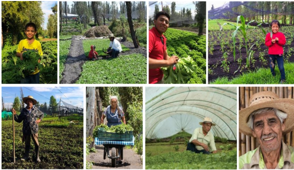
Imagen 10. La gente que cultiva las chinampas, San Gregorio Atlapulco

F. R. Chiapa Sánchez “El Paisaje Chinampero de la Ciudad de México ante el Cambio Climático”