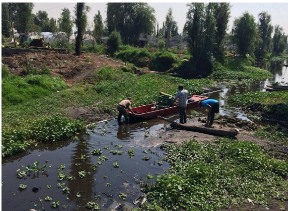
Imagen 5. Disminución del nivel de agua de la red de canales, Canal Nacional, San Gregorio Atlapulco

De acuerdo al artículo publicado el 31 de julio de 2020, en la edición para América del diario español El País, la temperatura en la Ciudad de México ha aumentado entre 1,8 y 2,6 grados en los últimos 15 años (Maldonado, 2020). En este sentido, fenómenos recientes como las olas de calor extendidas causantes de la evaporación acelerada de agua, aunado a la filtración por los agrietamientos profundos, son las principales causas de la pérdida gradual del nivel de agua de la red de canales, situación que contribuye al abandono, a veces definitivo, de un número significativo de chinampas anualmente (Imagen 5).