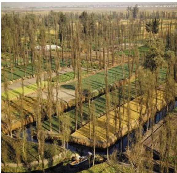
Imagen 4. Vista aérea de las chinampas

Vale decir que debido a los atributos relacionados con la alta productividad agrícola y su valor universal excepcional, fundamentado en la transmisión del saber hacer tradicional, el Sistema Agrícola Chinampero de la Ciudad de México, fue reconocido por la Organización de las Naciones Unidas para la Alimentación y la Agricultura (FAO) en 2017, como Sitio Importante del Patrimonio Agrícola Mundial (SIPAM).