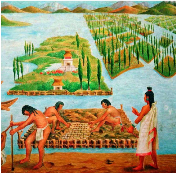
Imagen 2. Representación de las chinampas de México-Tenochtitlan © Fragmento de Mural, Museo Nacional de Antropología, Ciudad de México

F. R. Chiapa Sánchez “El Paisaje Chinampero de la Ciudad de México ante el Cambio Climático”