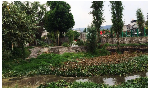
Imagen 9. Proliferación de flora invasiva en embarcaderos locales, San Gregorio Atlapulco

su reproducción es el referente a su modo de anidación, ya que son las raíces de los árboles y bordes de las chinampas los componentes del sistema más afectados. Estos nidos producen oquedades en los bordes que pronto se convierten en causa de colapso y caída de árboles. Durante los últimos años es notable la cantidad de bordes y árboles colapsados como resultado de este fenómeno. No obstante, las iniciativas llevadas a cabo recientemente por parte de instituciones educativas y gubernamentales, fundamentadas en la cooperación interdisciplinaria, han contribuido a la mitigación de esta problemática.