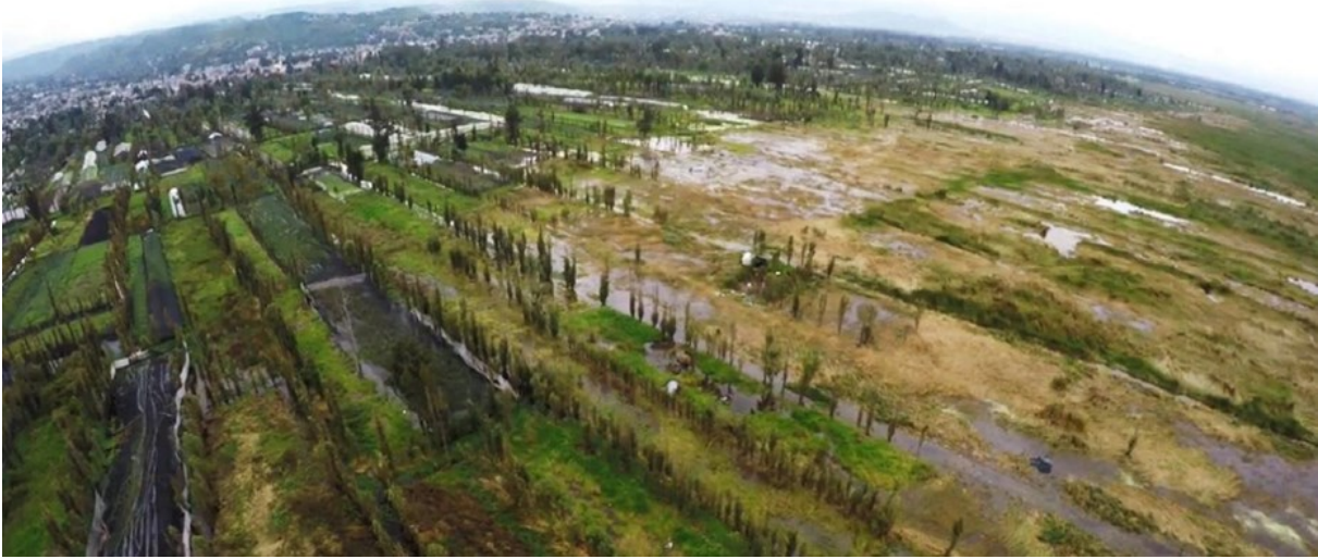
Imagen 6. Eventos meteorológicos extremos: chinampas inundadas, San Gregorio Atlapulco

F. R. Chiapa Sánchez “El Paisaje Chinampero de la Ciudad de México ante el Cambio Climático”