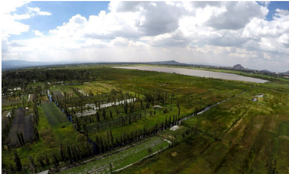
Imagen 8. Pérdida de masa arbórea a causa de la proliferación de plagas, San Gregorio Atlapulco

F. R. Chiapa Sánchez "El Paisaje Chinampero de la Ciudad de México ante el Cambio Climático"