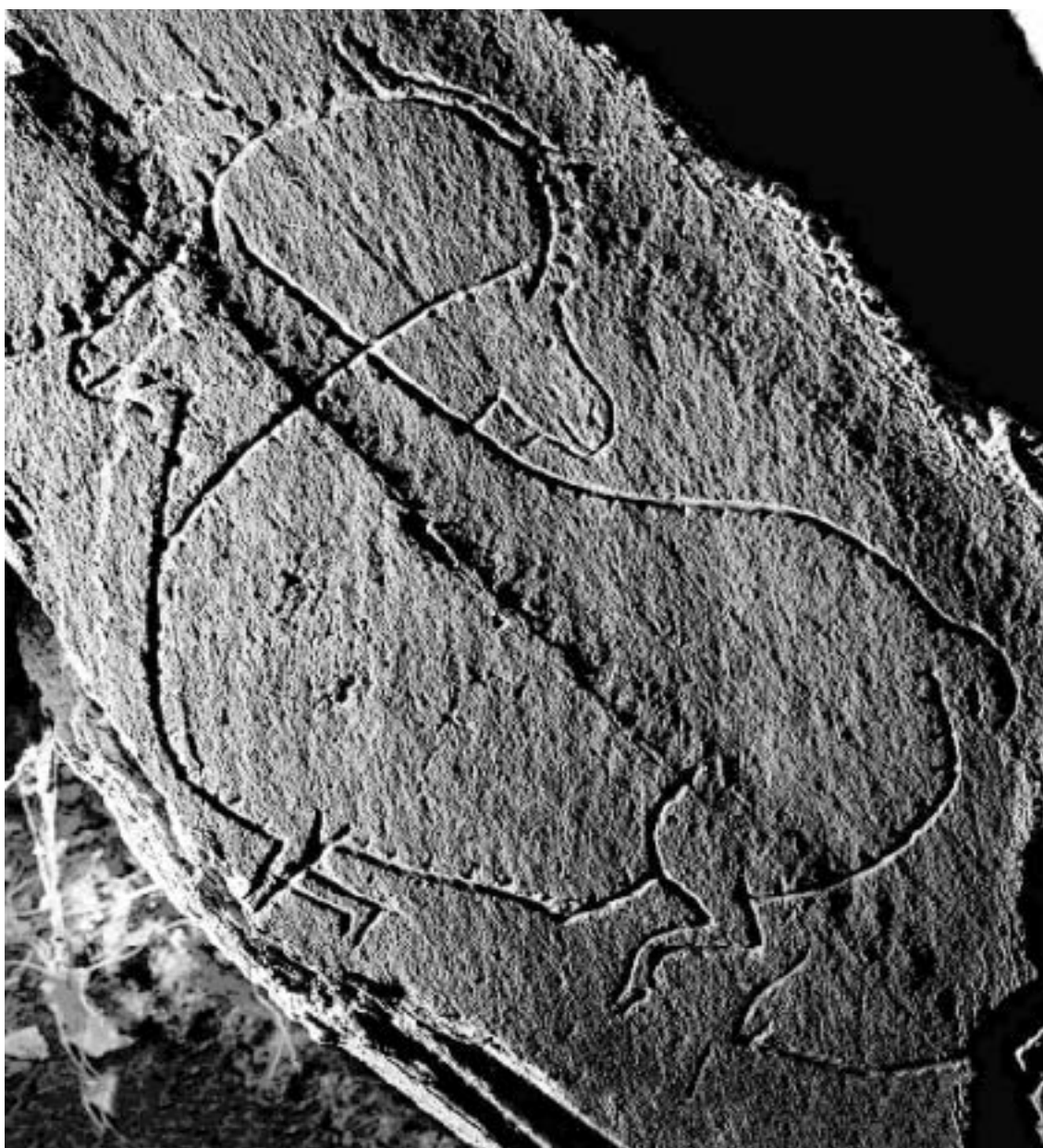
Fig. 4 Motivo caprino “animado” no Núcleo da Quinta da Barca.

A área de Portugal (e em certa medida também de Espanha, já que o sítio de Siega Verde fica a pouca distância da fronteira entre os dois países) onde este conjunto de sítios está situado encontra-se entre as regiões menos desenvolvidas social, cultural e economicamente da Península Ibérica, um factor que, apesar de tudo, ajuda a explicar a sobrevivência até aos nossos dias dos motivos rupestres. De facto, esta é uma área relativamente isolada, com uma população envelhecida e em diminuição, devido à falta de infra-estruturas tais como estradas, hospitais ou escolas, à ausência de médias e grandes indústrias e à conseqüente escassez de saídas profissionais. Este contexto motiva um fenómeno de desertificação considerável, alimentado por uma emigração em