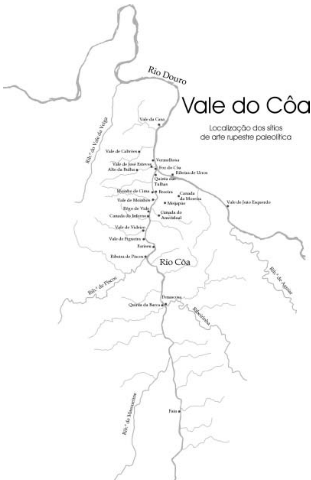
Fig. 3 Localização dos SARAL do Vale do Côa (mapa de Luís Luís).