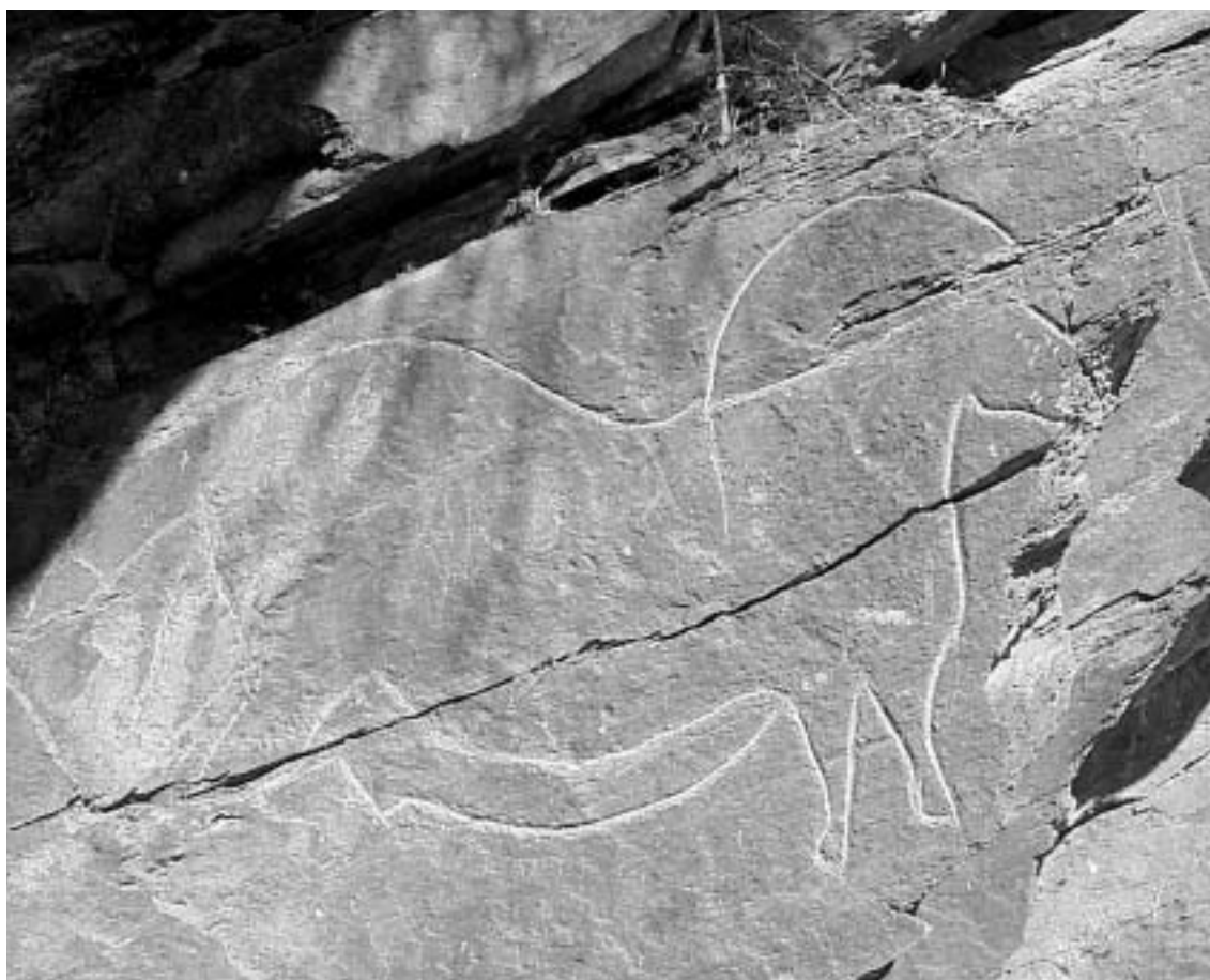
Fig. 11 Presente estado do “Cavalo de Mazouco”. De notar a “brancura” das linhas do motivo, resultado dos reavivamentos contínuos sofridos. De notar também a evidente discrepância entre as linhas do Cavalo e os traços de outra figura paleolítica, menos “renovada”, situada em frente da cabeça do Cavalo. São também visíveis alguns grafitos inscritos dentro do corpo do Cavalo.