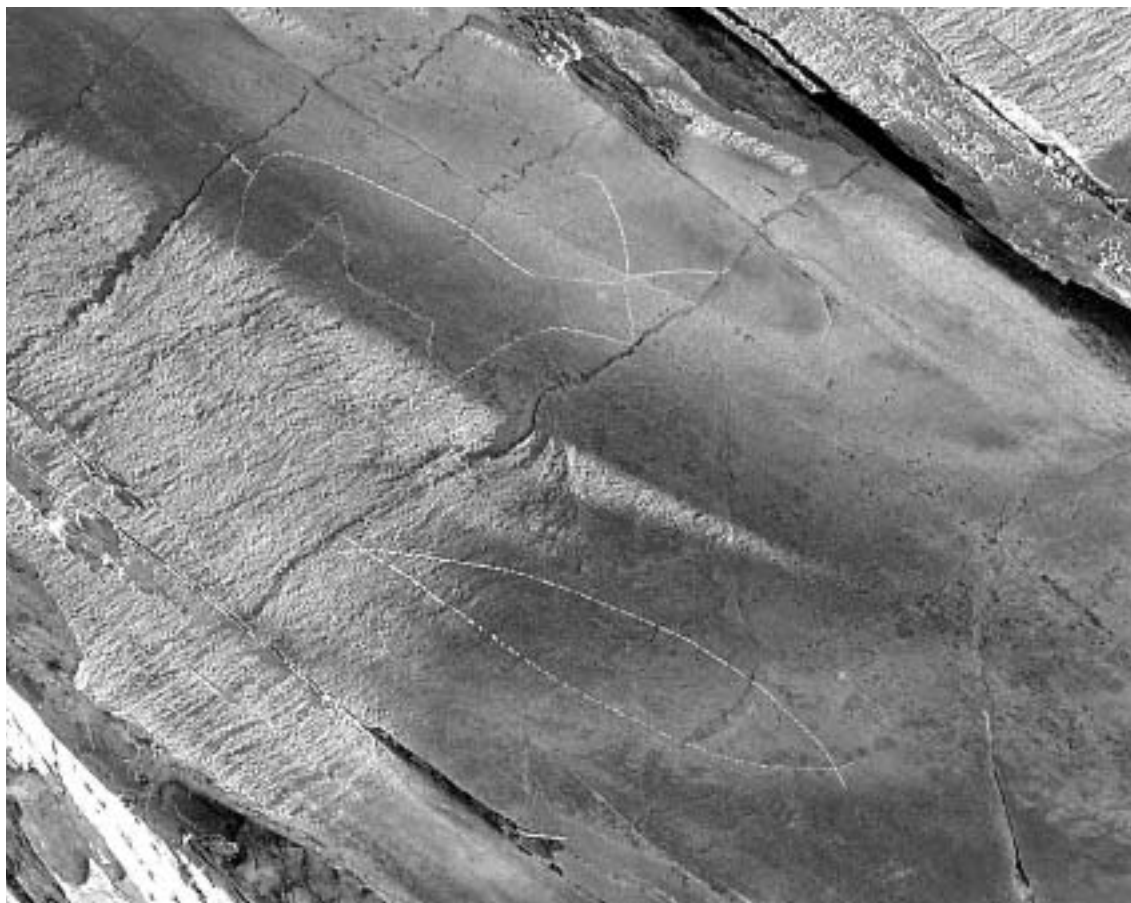
Fig. 9 Motivos “naive” (uma cabra e um peixe) gravados numa superfície xistosa da Penascosa.

Para os parceiros e comunidade locais a ideia de proteger as gravuras é de aceitação algo problemática. Se o desenvolvimento da região é um desiderato em que todos estão de acordo, os diversos meios propostos para o atingir são um pouco mais contraditórios. Os equívocos presentes no processo de criação do PAVC e as promessas governamentais não cumpridas levaram à existência de um clima de desconfiança entre o Parque, apercebido como uma entidade governamental exógena, e a comunidade. Os objectivos do PAVC são, no entanto, claros: protecção e apresentação pública das gravuras. Evidentemente que o fluxo de visitantes gerado pela existência de uma atracção turística como o Parque pode ser, e é já, um importante factor de desenvolvimento, mas nunca poderá ser o único. Do mesmo modo, as funções do Parque não passam pela construção