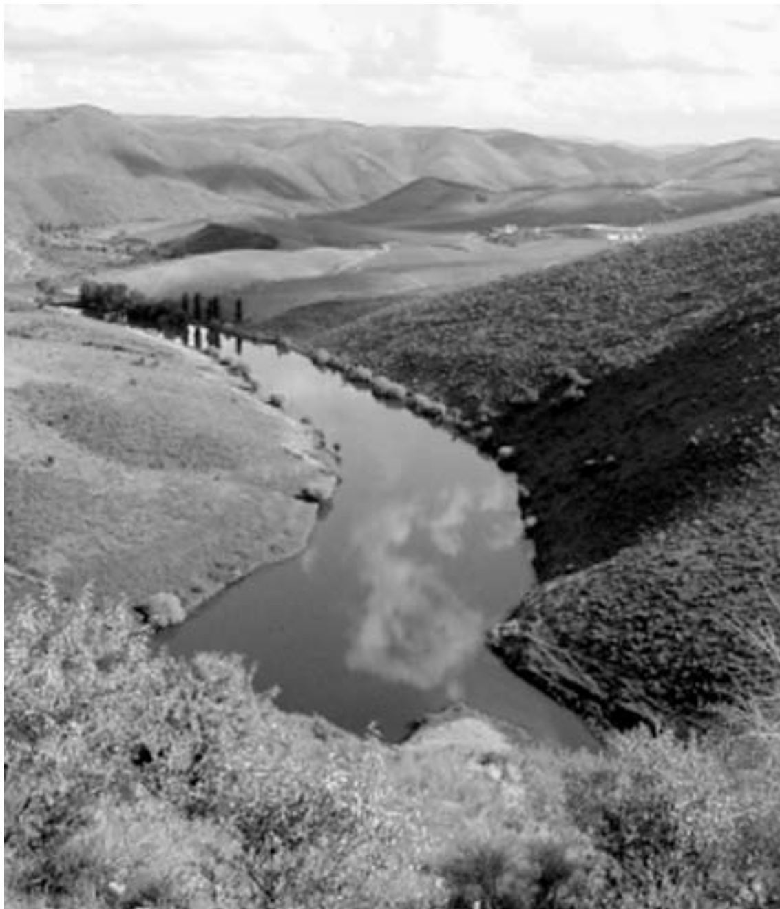
Fig. 5 A zona do rio Côa onde os Núcleos da Penascosa e da Ribeira de Piscos se encontram localizados.

apenas acesso aos três Núcleos visitáveis, se estiverem incluídos nas visitas organizadas pelo PAVC ou naquelas efectuadas pelas companhias privadas autorizadas pelo Parque. Os visitantes, num máximo de 8 pessoas por grupo, partem de três centros de recepção distintos, situados em diferentes localidades, para um dos três núcleos visitáveis — de Vila Nova de Foz Côa para a Canada do Inferno, de Muxagata para a Ribeira de Piscos e de Castelo Melhor para a Penascosa (Fig. 6) — num “passeio” tipo “safari”, em veículos 4 x 4 e acompanhados por Guias expressamente treinados e qualificados para descrever e interpretar as gravuras, integrando-as no seu contexto histórico, simbólico e paisagístico. De referir ainda que os Guias estão preparados para efectuar a visita em duas línguas para além do