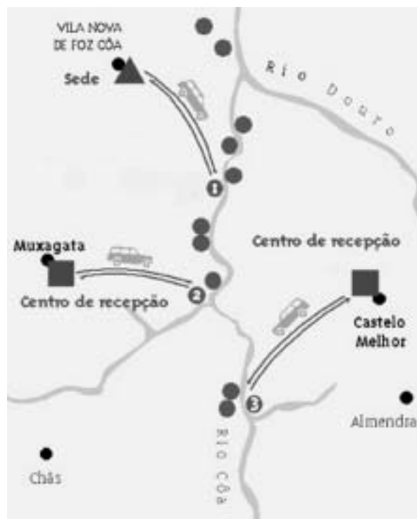
Fig.6 O esquema de visita implementado no Côa. 1. Canada do Inferno; 2. Ribeira de Piscos; 3. Penascosa.

português: francês e inglês. Uma vez que foram estabelecidos limites diários no número de visitantes nos três sítios abertos ao público — 48 pessoas na Penascosa (um número que pode chegar aos 52 por motivo de visita escolar a este Núcleo, o único que recebe este tipo de visita), 32 na Ribeira de Piscos e 32 na Canada do Inferno — os visitantes são aconselhados a marcar a sua visita com a necessária antecedência. Se visitantes “espontâneos”, não integrados nas visitas organizadas pelo Parque ou pelas companhias privadas, forçarem a sua viatura particular através dos caminhos carreteiros (que foram apenas pontualmente melhorados, sem sofrerem beneficiações importantes, tais como o alcatroamento, mantendo assim o seu carácter rústico e acidentado que assim contribui para a dissuasão das visitas “espontâneas”) que dão acesso aos 3 núcleos de arte rupestre abertos ao público, uma vez chegados à zona onde as gravuras se situam, encontrarão guardas, em serviço 24/h por dia e durante todo o ano, que os convidarão a