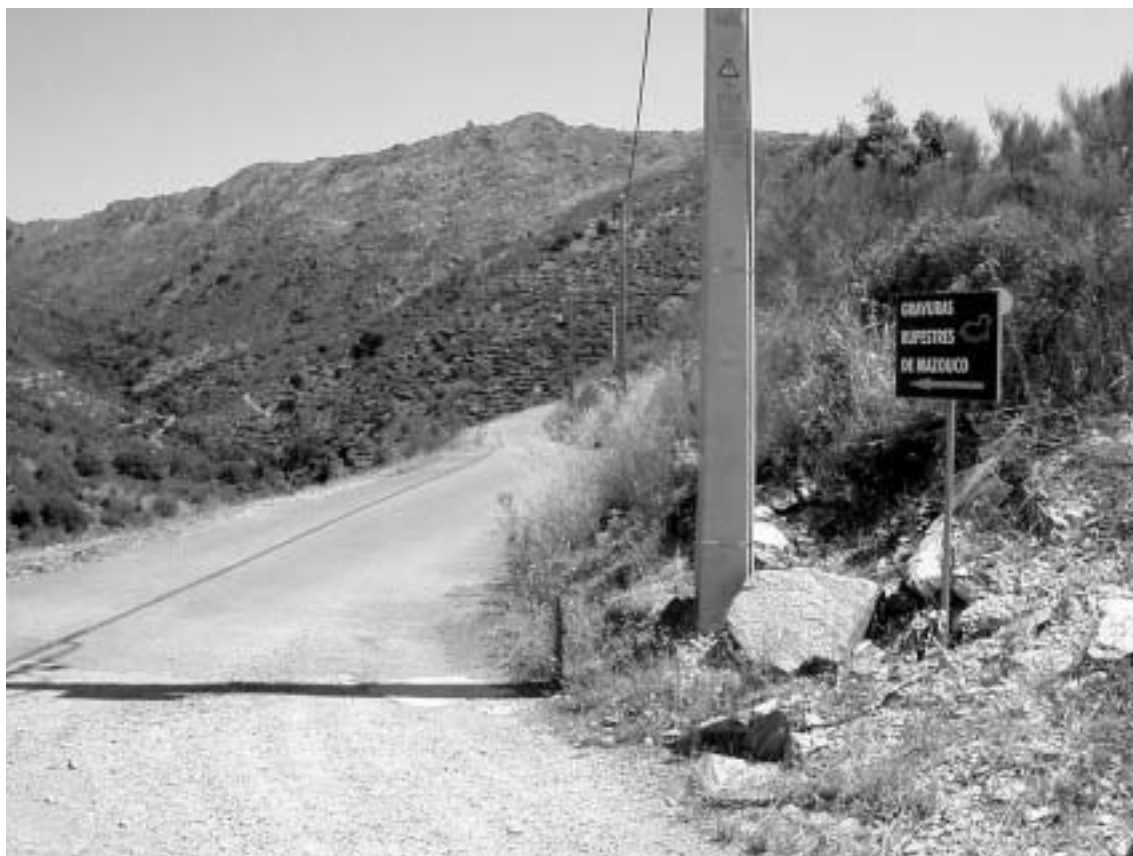
Fig. 8 Estrada de acesso ao sítio de Mazouco.