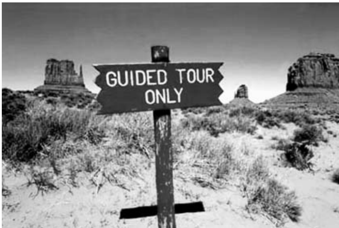
Fig. 1 Letreiro numa reserva Navajo, Arizona, EUA (Fotografia Navajo Land Tours/John Largo).

do acesso completamente vedado onde de todo não são admitidos visitantes até um sistema em que os sítios se encontram completamente acessíveis sem restrições de qualquer tipo. Entre estas duas abordagens antagónicas encontramos o método porventura mais utilizado, o sistema de acesso restrito, em que os sítios têm um número máximo de visitantes diário (como por exemplo na região francesa da Dordogne, onde várias grutas sofreram recentemente uma redução gradual no número dos visitantes diários [Dragovich, 1986]) ou em que apenas são permitidas visitas guiadas (como é o caso do Sudoeste dos EUA, onde várias tribos Nativas Americanas permitem apenas visitas guiadas aos seus locais patrimoniais de arte rupestre [Anyon et al., 2000] [Fig. 1]). De qualquer modo, mesmo nos sítios onde está em vigor um sistema de acesso restrito é por vezes necessário vedar temporariamente o acesso. É o que neste momento sucede na gruta de Altamira, em Espanha, que foi há pouco temporariamente encerrada, de modo a que estudos sobre a conservação dos seus motivos de arte rupestre possam ser realizados (El Mundo, 2002).