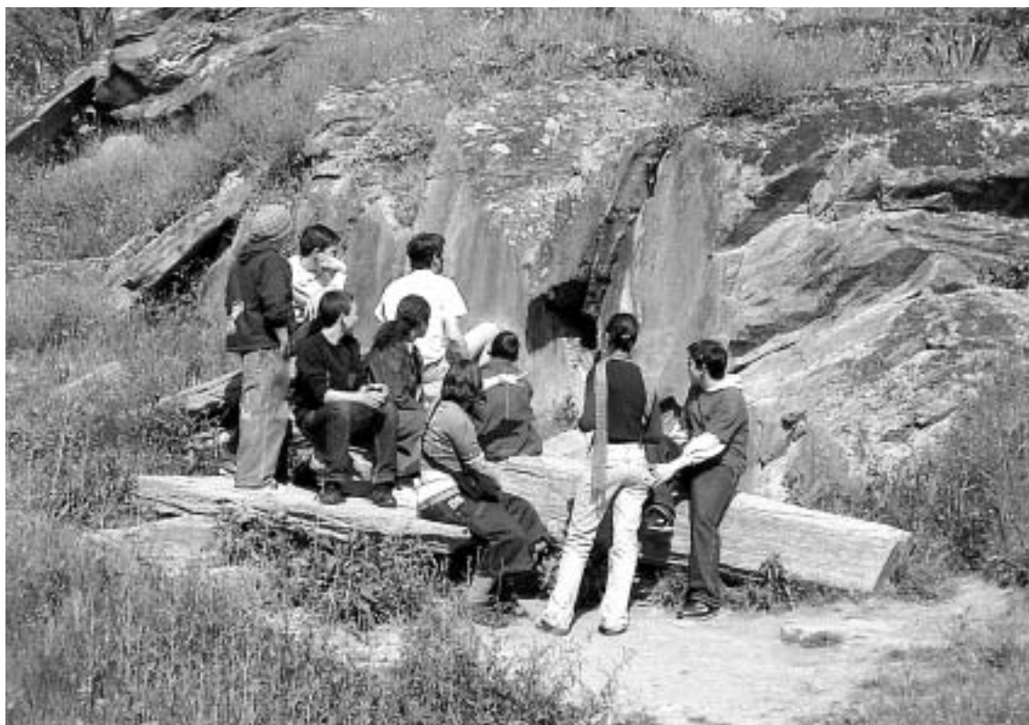
Fig. 7 Grupo de estudantes liceais visitando o Núcleo da Penascosa, acompanhados por um dos guias do PAVC.

Já em 1999, Paul Bahn, um dos grandes especialistas mundiais em arte rupestre, afirmou que ficou “muito impressionado com a rapidez e a qualidade do que aqui (no Côa) se fez. É um exemplo extremamente importante e impressionante a nível mundial” (Bahn, entrevistado por Pereira, 1999). Em 2001, Ulf Bertilsson, actual presidente da Comissão de Arte Rupestre do ICOMOS ( Internacional Council of Monuments and Sites , organismo da UNESCO que superintende a gestão dos sítios inscritos na LPM), manifestou-se “muito impressionado com o trabalho que está a ser desenvolvido no Côa” (Bertilsson, entrevistado por Garcias, 2001b). Um casal de Aborígenes Australianos partilha também destas opiniões e, depois de visitar o Côa em 1999, declarou que “O Parque está muito bem organizado, existem regras muito fortes e os visitantes são guiados por pessoas que percebem o que mostram. Esta é uma boa maneira de tomar conta de um Parque.” (Peterson e Tjamiwa, entrevistados por Pereira, 1999).